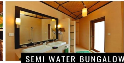
SEMI WATER BUNGALOW