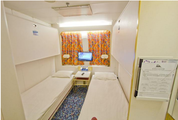
INSIDE (ห้องพักไม่มีหน้าต่าง)